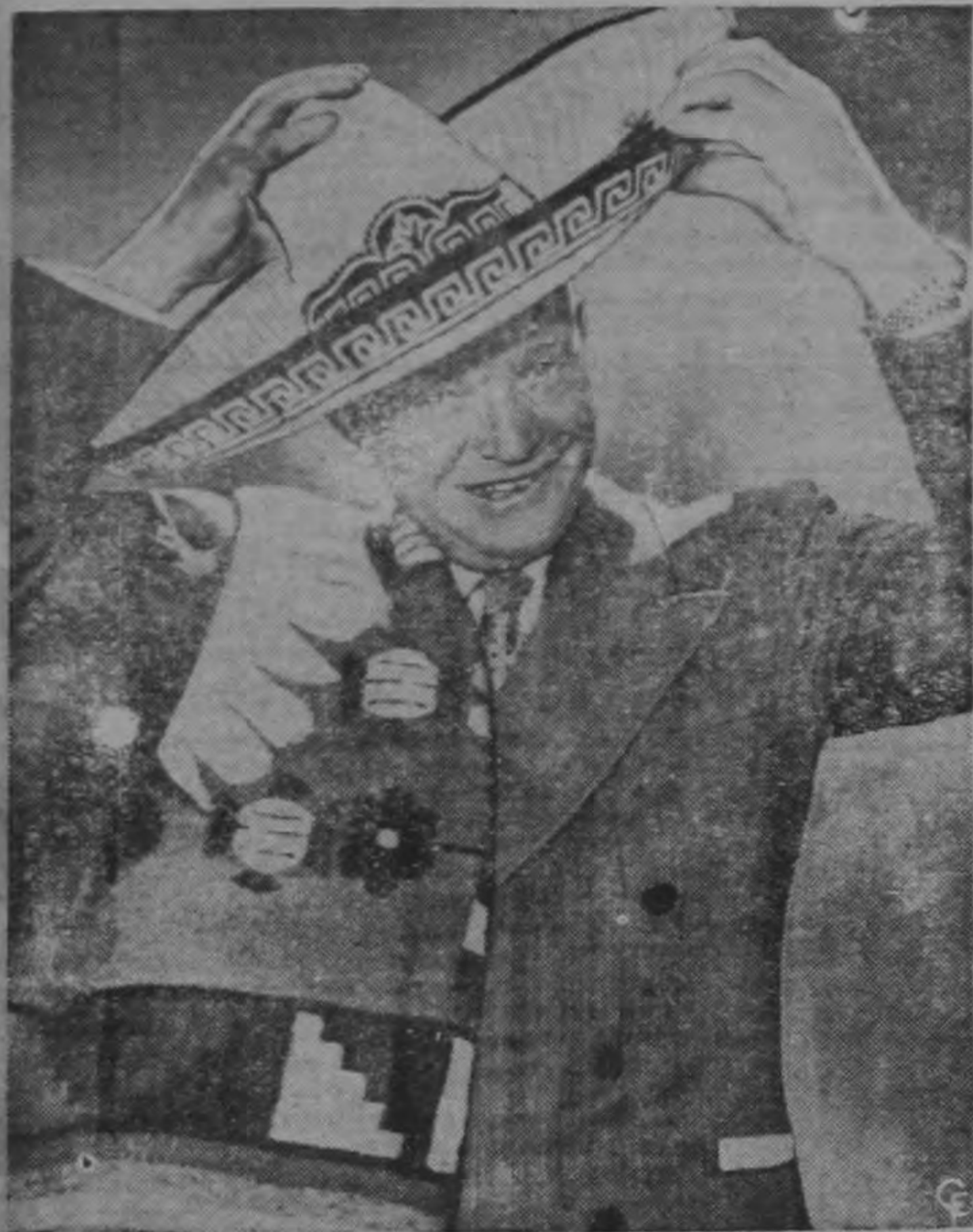
El General Dwight D. Eisenhower se prueba un sombrero mexicano y un zatape durante una breve escala en San Diego, California. Estos atavíos le fueron regalados al candidato presidencial republicano después que dijo a una multitud que le ovacionó que la administración actual está manejada por "hombres hambrientos de poder" que quieren dictarle al pueblo el modo en que debe vivir.