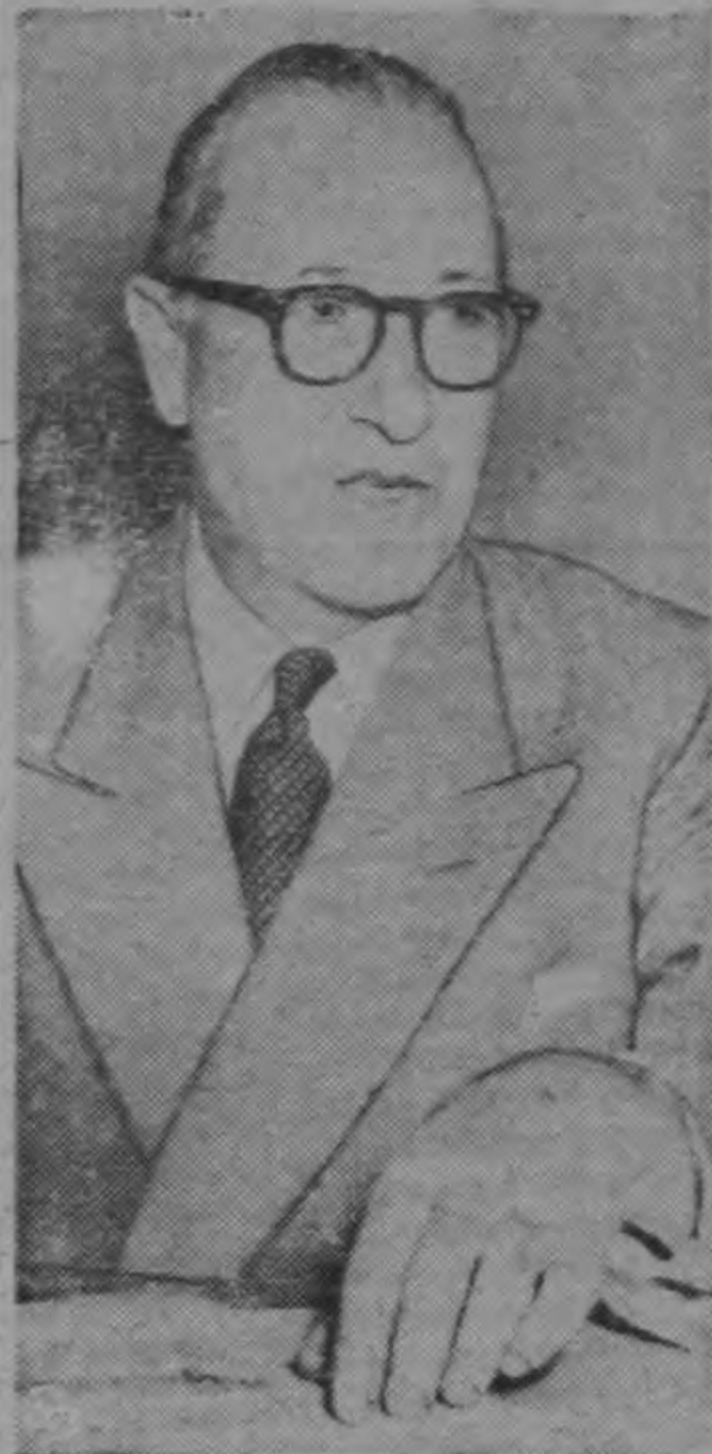
George Wadsworth, diplomático de carrera de 58 años de edad ha sido nombrado Embajador de los Estados Unidos ante el gobierno comunista de Checoslovaquia. El nombramiento por el Presidente Truman se anunció mientras el nuevo embajador checo a los Estados Unidos llegaba silenciosamente a Washington. La tarea más importante de Wadsworth será renovar los esfuerzos por obtener la libertad de William N. Oatis, corresponsal-periodista norteamericano.—(INP).