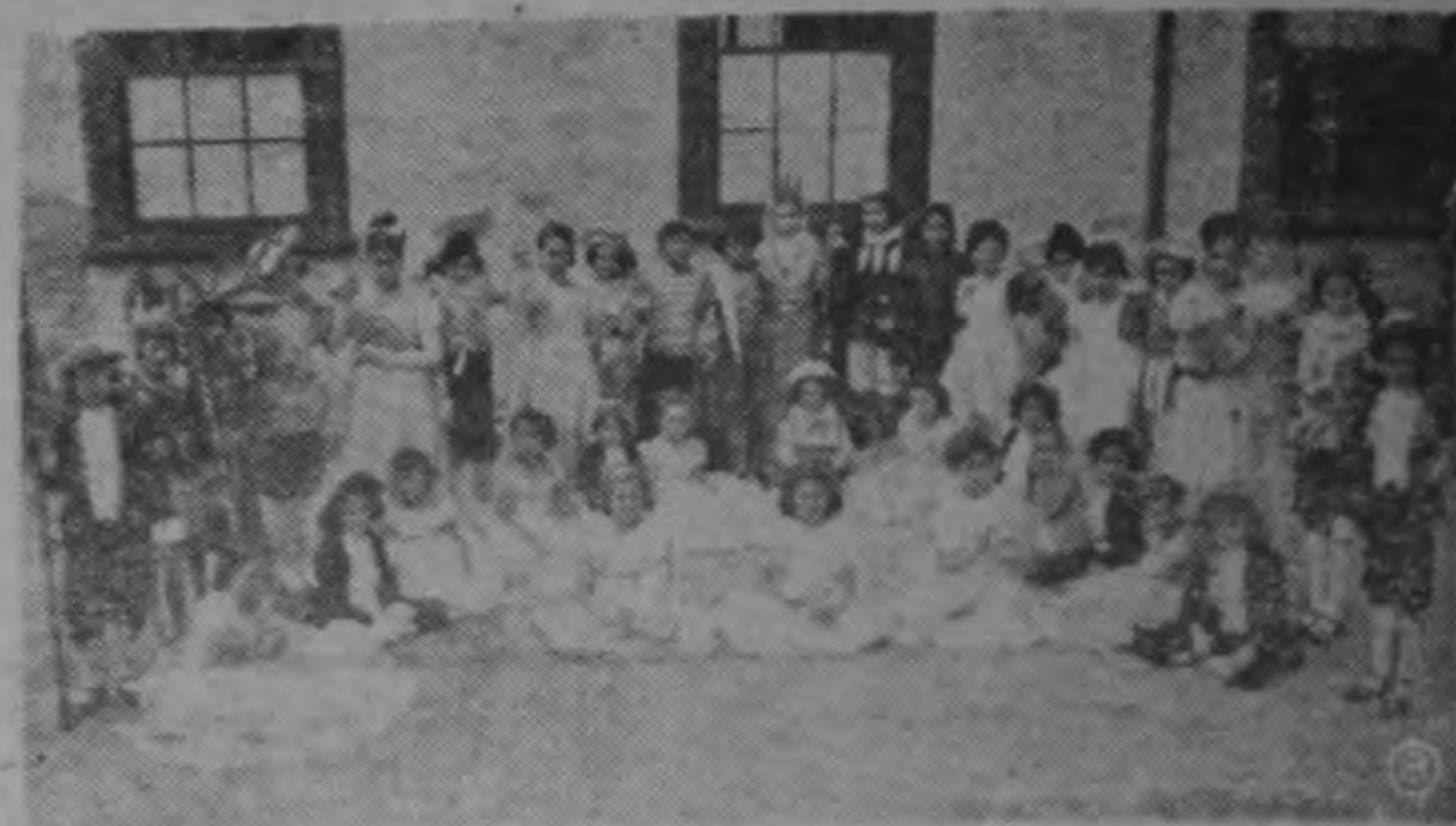
Cuadro evocativo formado por las niñas de la Escuela República del Toró, durante la fiesta realizada en ese plantel con motivo de la celebración del Día de la Raza.—(Foto Arévalo).